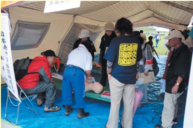
こうしゅう けんがく AED講習を見学

8月30日（土）雨の中、メイン会場の神栖中央公園において予定通りの内容で実施されました。訓練はマグニチュード7.7の地震が発生して、神栖市は震度6強を観測し、大津波警報が発表された想定のもと、日本語だけでなく英語、中国語などの外国語でも避難指示が出されました。KIFAからは約15名の参加があり、茨城県国際交流協会の誘導のもと7つのグループに分かれて、真剣な訓練が行われました。