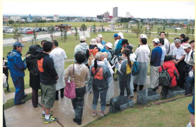
やま ひなん つき山に避難