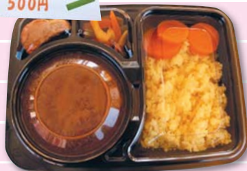
きーまーここなつつかれー (インド料理) キーマココナツカレー (インド料理)

材料：(材料は全てみじん切り) 鶏挽肉 300g、玉ねぎ1個、トマト1個、ジャガイモ 2個、人参1本、トマト水煮1缶、香辛料適量、レッドカレーペースト適量 ココナツミルク1缶、ターメリック適量、バター大さじ1、米1谷