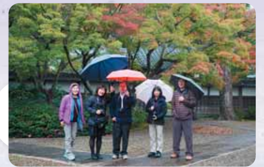
きいふあ10号 撮影研修 (潮来の長勝寺)