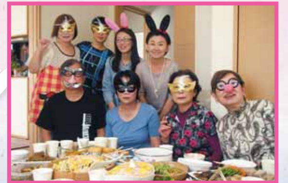
ほむびじつとさんかしゃ ホームビジット参加者