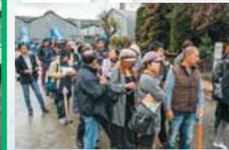
せいしじょうさんさく 製糸場を散策