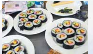
ふとま きれいにできた太巻きずし