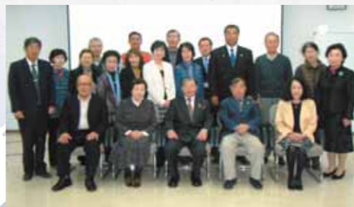
さんしかしまいたこかみすこうりゅうかい 三市(鹿嶋・潮来・神栖)交流会