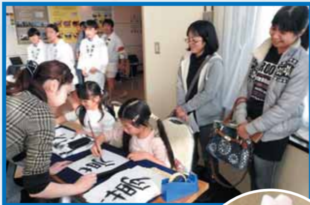
たのしくお習字体験 楽しくお習字体験