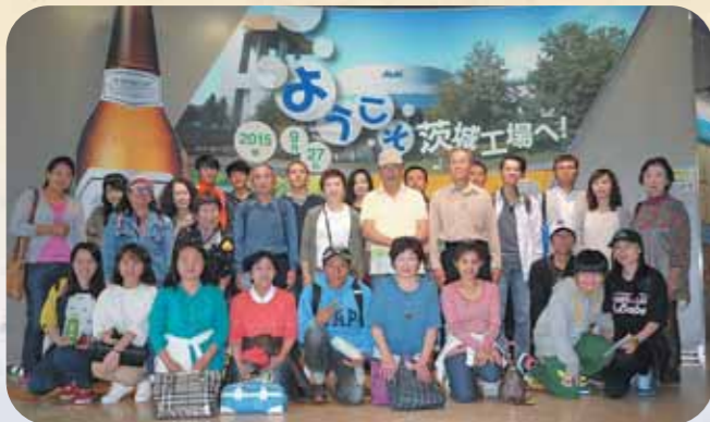
けんしゅうこうりゅうかい 研修交流会(守谷市国際交流研修センターほか)

がいこくじん 外国人による日本語スピーチコンテストに参加 (鹿嶋市国際交流協会主催)