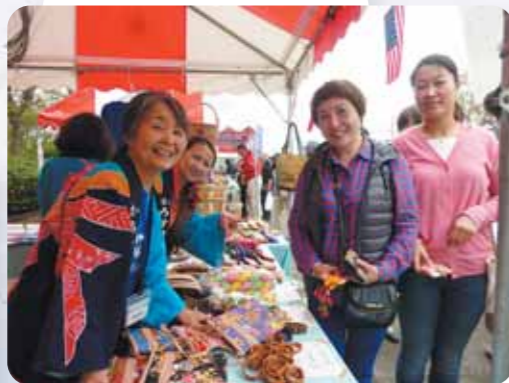
かみすたさいふあしゅつてん 「かみすフェスタ2015」にKIFAも出店 がいこくりょうりみんげいこものるいはんばい 外国料理と民芸小物類を販売