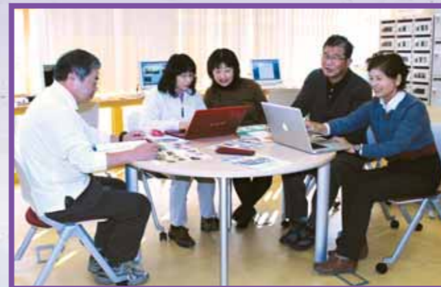
きいふあ10号 編集会議