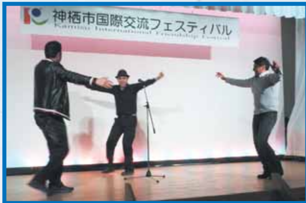
もあいらんじんだんすたいむ 盛り上がったイラン人によるダンスタイム

かみすしこくさいこうりゅうふえすていばる 神栖市国際交流フェスティバル (2016年2月28日)