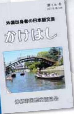
ぶんしゅう 文集「かけはし」 じむきょく 事務局にて えつらん 閲覧できます