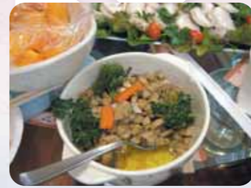
おいしそうなイラン料理が いっぱい