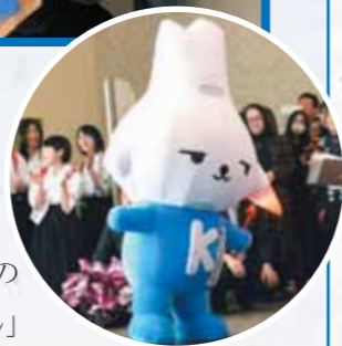
かいじょうないだいにんき 会場内でも大人気の「カミスココくん」