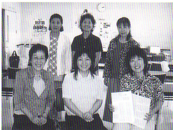
楽しい広報誌づくり研修会(6月19日・20日)

私のふるさはニューヨーク州で、英語教師として神栖に26年間住んでいます。神栖の皆さんよろしく申し上げます。