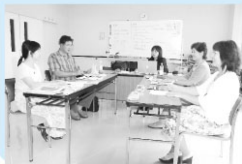
広報誌作り研修会で勉強中

広報誌作り研修会を実施し、充実した「きい〜ふあ2号」の発行に努力しました。今年5月以降「広報かみす」毎月1日号に掲載する協会のお知らせ欄「きい〜ふあ」(KIFA)を担当しています。また、5月にはホームページが開設され、委員会活動や協会事業を常時閲覧できるようにしました。ホームページの更新には4名の広報委員が講習会を経て担当しています。協会の各種イベントの取材や宣伝活動にも取り組んでいます。