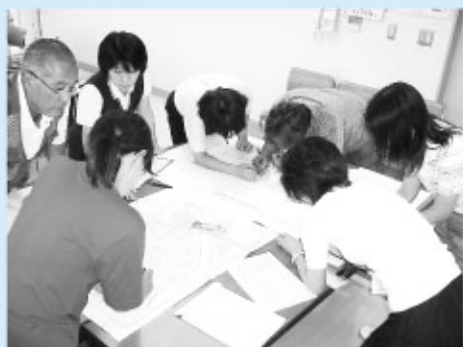
現在11名のメンバーで作成中